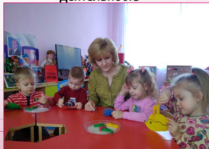
«Развитие сенсорной культуры»