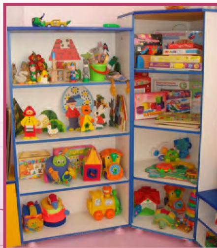
«Центр дидактических игр»