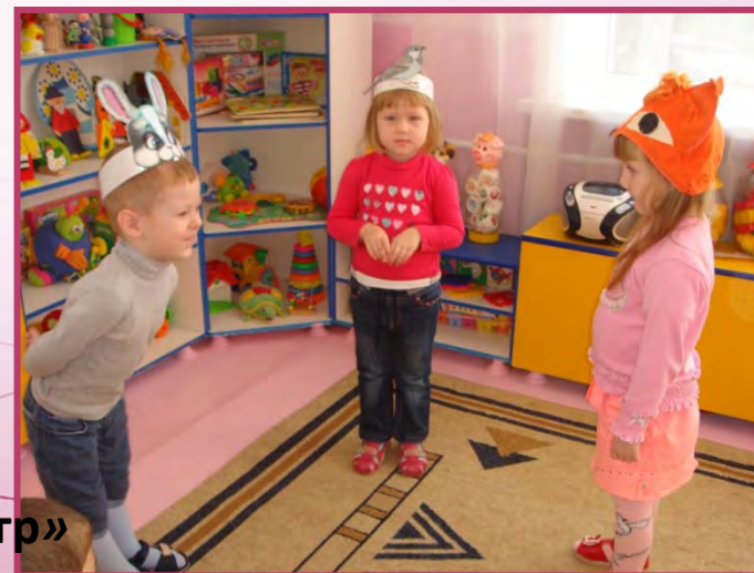
«Центр театрализованных игр»