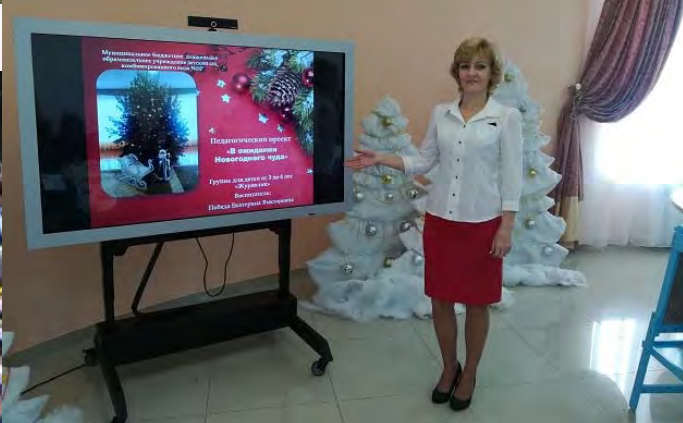
Педагогический проект «Счастливый Новый год»