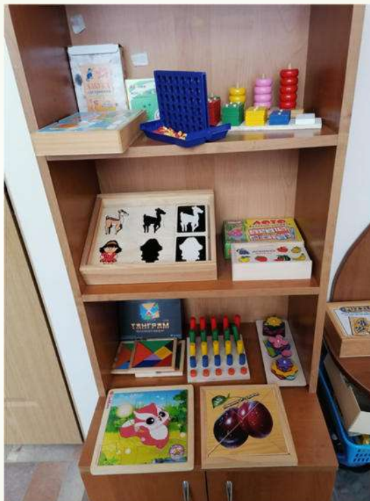
ЗОНА СЕНСОРНОГО РАЗВИТИЯ