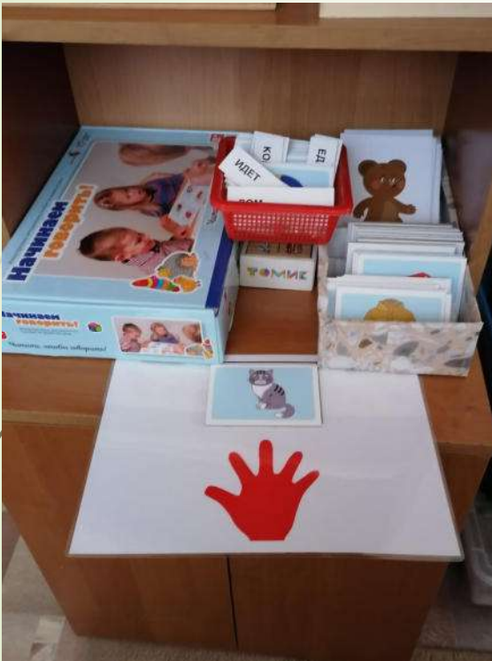
Зона речевого сопровождения