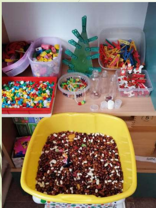
Зона развития мелкой моторики