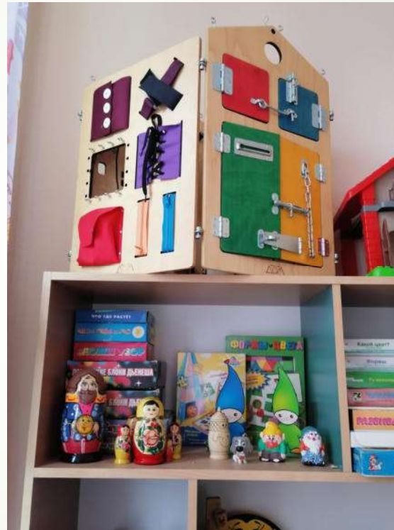
Зона игрового сопровождения