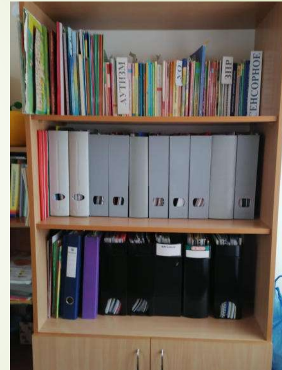
Зона методического сопровождения